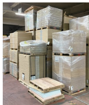
●一部がよく使う用紙は在庫しています。