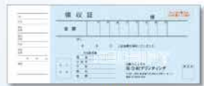
733W(枠付) 複写 小切手耳付タイプ