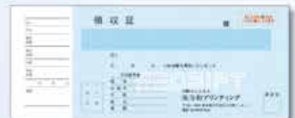
734W(枠なし) 複写 小切手耳付タイプ