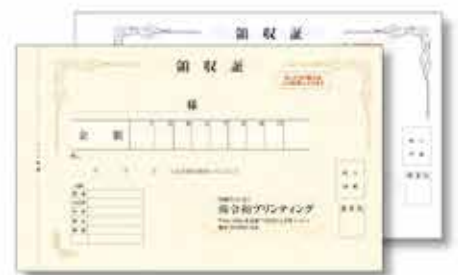
727W(枠付) 複写 大判高級タイプ