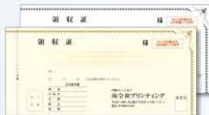
729W 複写 小切手判横長タイプ