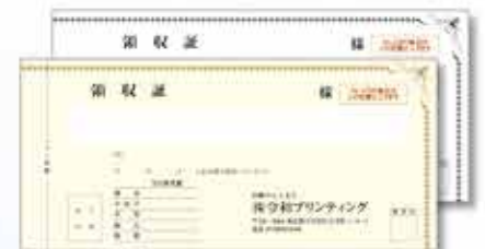
730W 複写 小切手判横長タイプ(白マド)