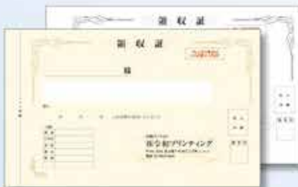
728W(枠なし) 複写 大判高級タイプ(白マド)