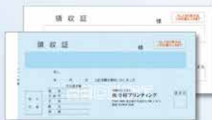
732W(枠なし) 複写 小切手判タイプ