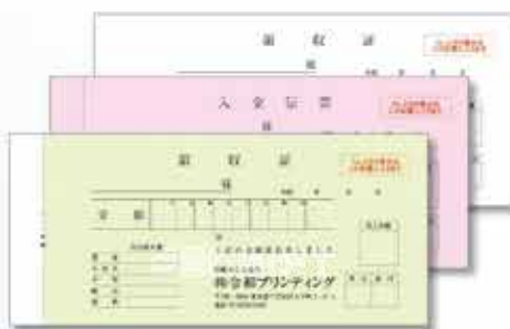
726N(入金伝票付) 複写 小切手判タイプ