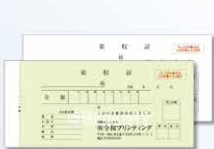
725N 複写 小切手判タイプ