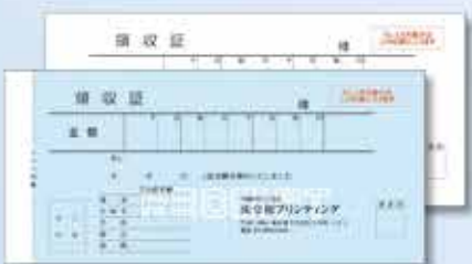
731W(枠付) 複写 小切手判タイプ